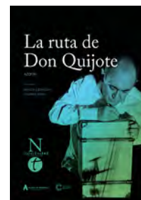
2016 La ruta de don Quijote