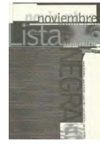
1997 Lista negra