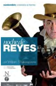
2012 Noche de reyes