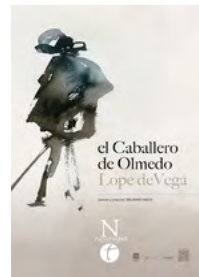
2017 El caballero de Olmedo