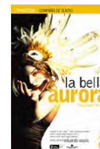
2003 La bella aurora