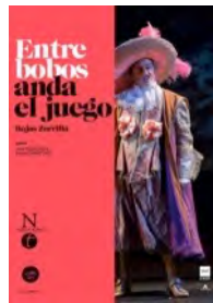
2018 Entre bobos anda el juego