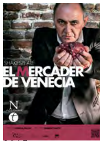
2015 El mercader de Venecia