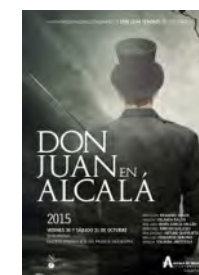
2015 Don Juan en Alcalá