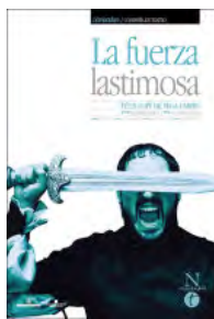
2001 La fuerza lastimosa