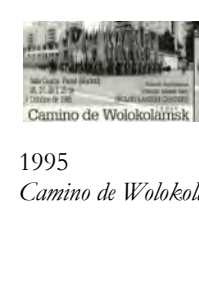
1995 Camino de Wolokolamsk