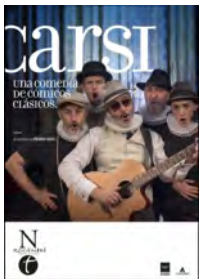
2019 Carsi, una comedia de cómicos clásicos