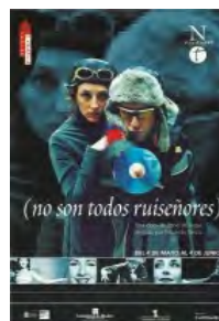
2000 No son todos ruiseñores