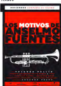
1998 Los motivos de Anselmo Fuentes