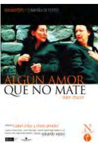
2002 Algún amor que no mate